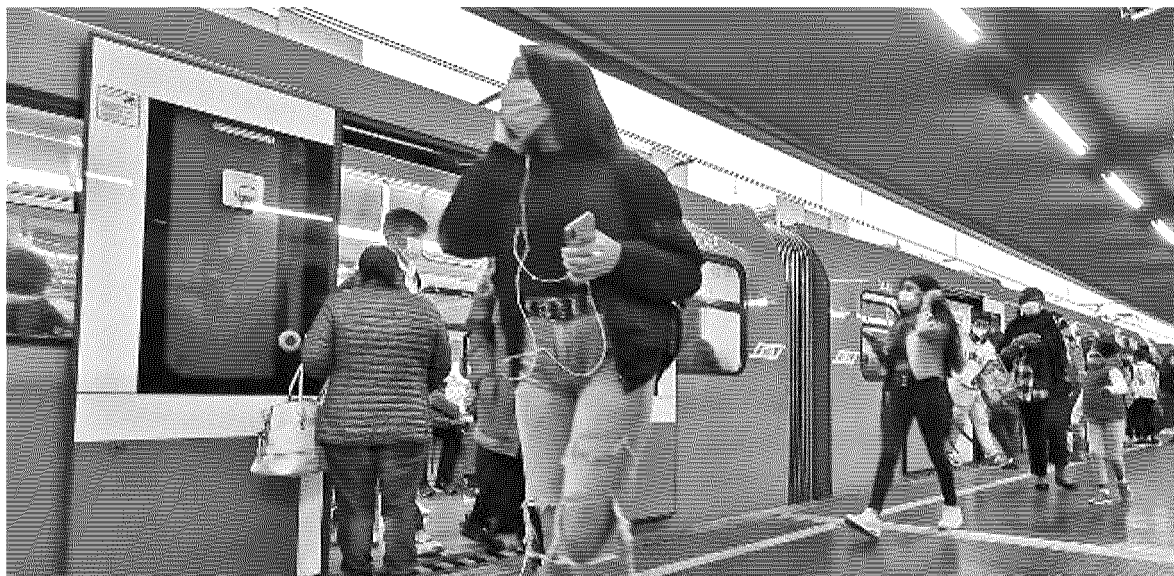
I trasporti pubblici milanesi sono messi alla prova di fronte alla nuova ondata di contagi